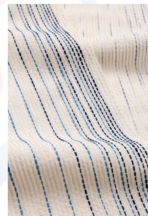
おしゃれ八寸名古屋帯